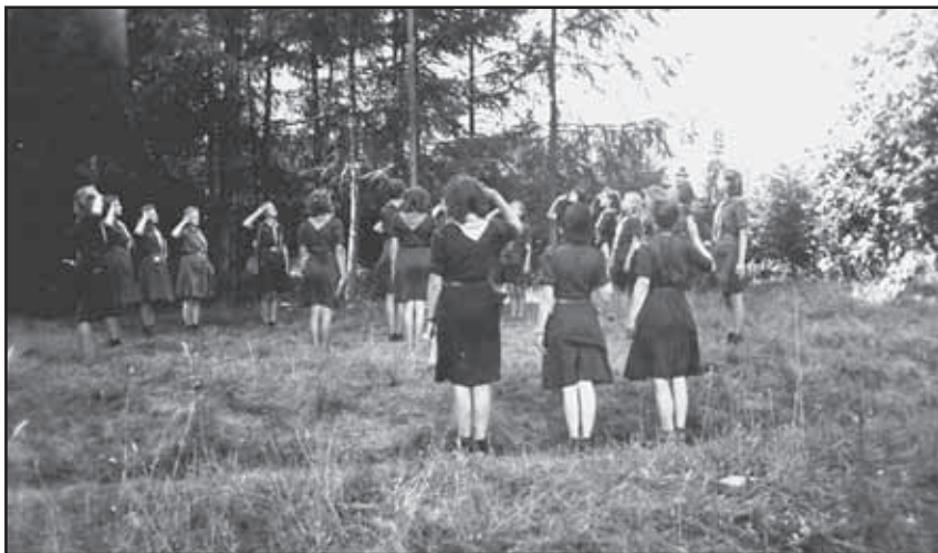
Op zomerkamp bij kasteel Den Bramel, 's morgens vlag hijsen.

Mw. Rouwenhorst stelde ons ook nog twee foto's uit die tijd ter beschikking. Deze waren gemaakt vlak na de oprichting van de meisjesgroep: