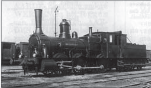
De opzet van de treindiensten