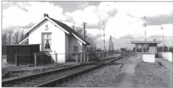
Warken op 14 april 1962, Woning 3 bij de voormalige halte bij km 3,5. R. Ankersmit

De straatzijde van station Vorden, omstreeks 1920. L.J. Biezeveld