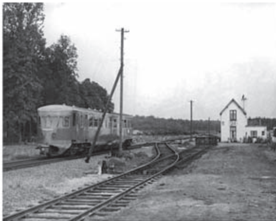
Brandenborch met Woning 24 op 9 augustus 1956, gezien richting Zutphen. Het reizigersverkeer is weg, maar de losplaats is nog in gebruik. Een Blauwe Engel passeert als trein 3825 Apeldoorn - Winterswijk. R. Ankersmit

De eerste stoomlocomotieven haalden 45 km/u.