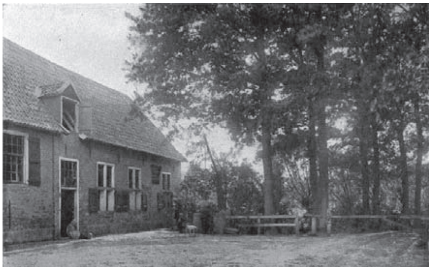
Museum-boerderij De Lebbenbrugge, wegzijde (illustratie in het bewuste artikel).

Dat is tegenwoordig wel anders, nu zeg je met gepaste trots: Ik komme uut den Achterhoek en dan denkt iedereen dat je een Tukker bent en, enfin, laat ze maar mooi in die waan.