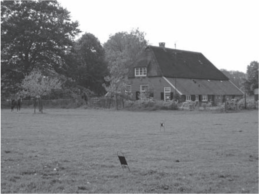
Het Timmermanshuis aan de Riethuisweg te Vorden