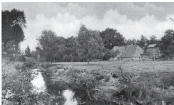
De Lebbenbrugge aan de Lebbinkbeek bij Borculo, zoals afgebeeld in het hier weergegeven artikel.

In de loop der jaren heb ik, onder het motto “een löslopenden hond vindt altijd wat” de neiging ontwikkeld om op rommelmarkten te lopen snuffelen in dozen met boeken en geschriften die betrekking hebben op onze Achterhoek in vroeger tijden en ik vermoed dat meerdere leden van onze vereniging dat ook in meer of mindere mate hebben, want dat willen we graag weten toch, hoe ging het er hier vroeger aan toe in deze streken?