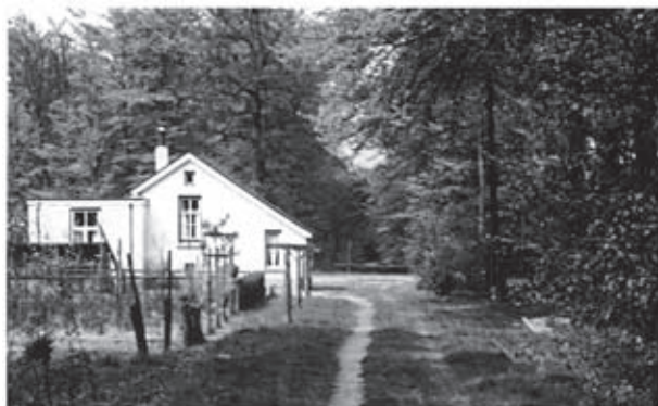
Het nog goed herkenbare tracé Doetinchem - Ruurlo, met Woning 9 aan de (voormalige) overweg in de Rijksweg Zutphen. Winterswijk, 7 mei 1964. Deze woning bestaat in dezelfde vorm nog steeds. F.J. Hoevenagel

Op 1 oktober 1945 startte de NS een busdienst Vorden-Zutphen en een treindienst Vorden-Winterswijk, die vier keer per dag reed. Op 28 januari 1946 reden er weer