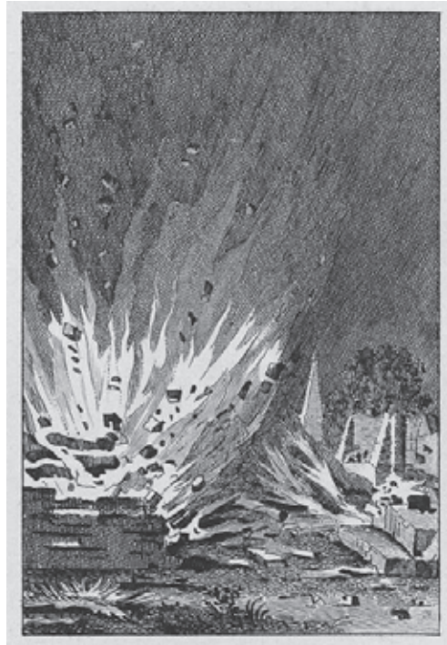
Verwoesting van het grafmonument van de familie van de Capellen te Gorssel.