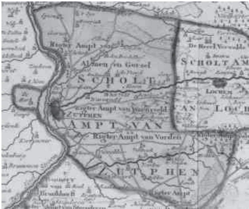
Kaart met de belangrijkste wegen van het schoutambt Zutphen rond 1650.

Deze lijst aan den Scholtus van Westerholt overgegeven d.d. 29 April 1803