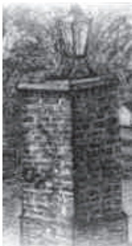
De pomp in Batenburg (naar een tekening van P. de Wit sr.)