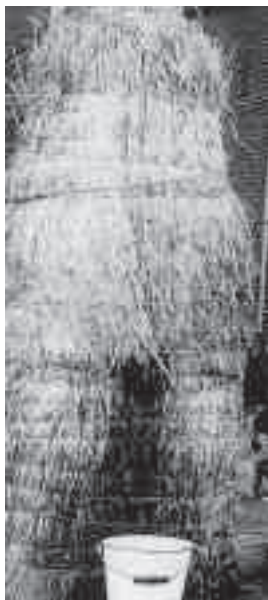
Pomp ingepakt tegen het bevroren