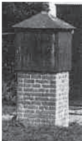
Pompen in diverse uitvoeringen (hout, steen, hout en steen, enz.)

In de iets mindere oude tied word'n die putte op-evolg'd deur een pompe. Heel vake gebeur'n 't wel dat d'r een pompe eplaatst word'n op de waterputte. Zee wis'n dan zeker dat d'r water was. Ging dat neet zo gemakkelijk, of was de putte wat vergaon of, wat ok veurkwam, dat 't water van wat mindere kwaliteit was, dan mos d'r een buize de grond in, töt op een water-aor. De onderste buize was veurzien van geatjes, zodat daordeur 't (grond)water op-ezoagen kon word'n. Heel vake was der dan ok met een wichelroedeloper een goeie wateraor op-ezog. Op de pompebuize word'n vake een simpele handpompe ezet en der ummehen word'n dan een holten kaste eplaatst die vake weer op een stenen voet ston. De pompen van latere tied waar'n ok heel vake uut-evoerd in metselwerk, met een holten kop, zo-as op de foto's hiernäös.