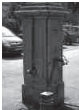
De pomp in Vorden van 1931

De in 't begin ge-nummde pompefoto's van G. Rossel hebbe wielle hier zo hier en daor an-eduud; veur zover d'r ons iets over bekend is, of dat d'r wat over achterhaald kon worden, beschrieve wielle ze dan ok. Een echten 'olderwetsen' dorpspompe, zo-as de pompe die hiernao af-ebeeld is zo ene as den in Vorden an 't begin van de Dorpstraote