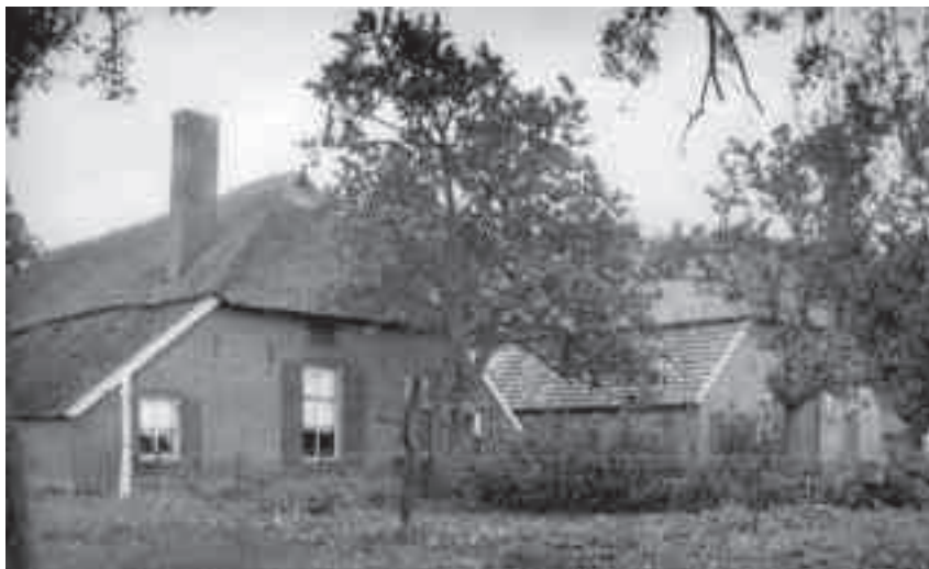
Het oude huis, gebouwd in de 18e eeuw. Huis in 1953 verbouwd tot veestalling en in 1972 afgebroken (foto genomen in 1947).

overstap: in twee generaties van Lentink uit de Leuke via Voskamp naar de Voskuil in Mossel. Deze drie boerderijen waren overigens minder dan twee kilometer van elkaar verwijderd: men trouwde in de buurt.