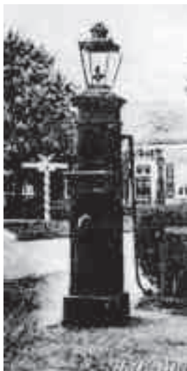
Oude pomp in Vorden

ston en dienst dee as openbare waterveurziening veur de omwonenden, maor ok as waterbron bie brand.