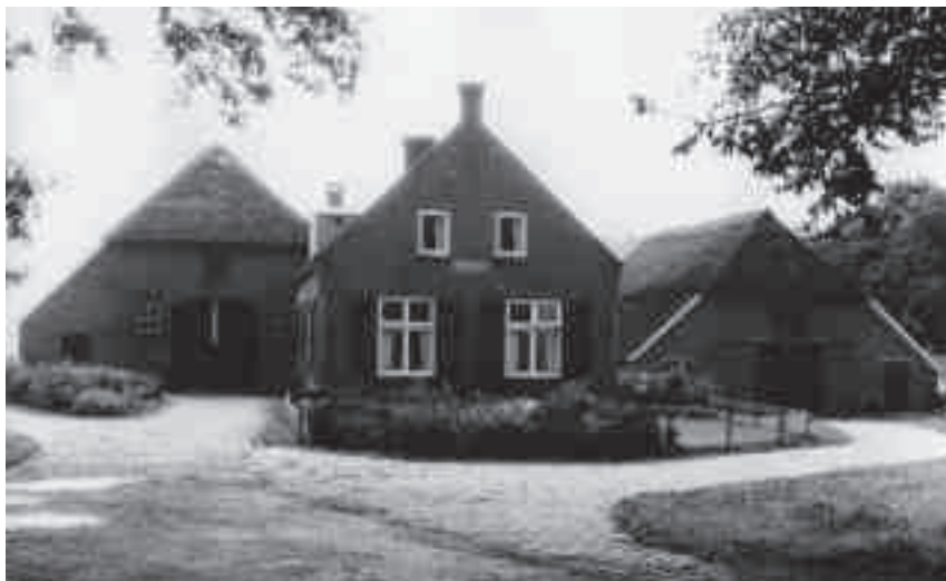
De Voskuil in 1965

met dat Achterhoekse landschap als zodanig was misschien nog wel sterker dan de verbondenheid met de plek, met de Voskuil. Zijn vader, Jan Berend, was weliswaar zeker geen echte boer zoals zijn vrouw en zoon dat wel waren, maar ook hij voelde zich sterk verbonden met de streek. Hij was zelf eigenlijk meer een gemankeerde dominee, die door familieomstandigheden in het boerenbedrijf was gerold. Het cultuurlandschap in de Achterhoek, het “coulissenlandschap” met bossen en bosranden, veranderde door herverkaveling en schaalvergroting, maar bleef in stand. De Voskuil zelf veranderde ook. Van een plaatsje op de zandgrond werd de boerderij langzaam maar zeker een volwaardig gemengd bedrijf, waar een gezin van drie generaties met een knecht en een meid een bestaan hadden. Bertus Voskamp maakte niet minder dan zijn vader een bijzondere dynamiek mee. De betekenis van de Tweede Wereldoorlog en de navolgende snelle sociale veranderingen in Nederland plaatsten hem en zijn latere vrouw Dinie (Egberdina Alberta Johanna) Hemeltjen (Almen, 1932-, ook weer een huwelijkspartner buiten Vorden) ronduit in een nieuwe tijd.