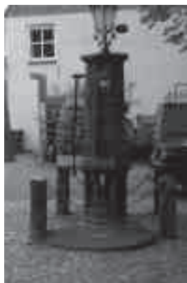
De Warnsveldse pomp