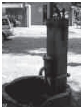
De pomp in Enter

Um is te laoten zien hoe of der vrogger diverse pompmodellen in umloop waor’n, he’w d’r hierbie enkele bie mekare af-ebeld. Oordeel zelf maor wat mooi of lelijk is. Een aardigheidje is bieveurbeeld ’t pumpken in Enter, waor hieronder ok ’n foto van eplaatst is. En um ’n betje wieter van huus te gaon, hebbe wiede d’r ok een foto van een pompe in ’t Zeeuwse plaetsken St. Kruis bie ezet.