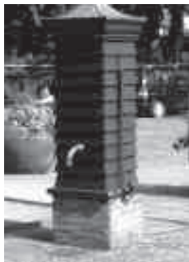
De pomp in Keppel