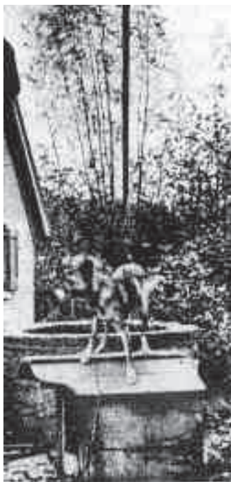
Waterput zoals vroeger heel vaak bij boerderijen stond.

Bovengronds word'n dan meestal een rand van steen emetseld, ok wel van zogenaamde putstene veur de ronde vorm. Um een goeie plaatse, ofwel een water-aor te vinden word'n d'r ok wel 's gebruik emaaft van een wichelroedeloper.