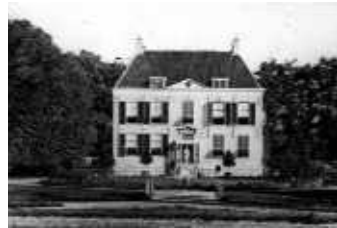
Den Bramel omstreeks 1875