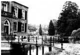
De brug voor het huis

Op 26 november 1881 kunnen we weer een verkoop van afbraak in de krant aantreffen. Dit maal werd onder meer een grote hoeveelheid dakpannen, lood, etc. te koop aangeboden. Het tegenwoordige, met leien gedekte dak werd toen aangebracht. Een leien dak, dat gold in die tijden als zeer deftig. Ook het Medler en het Onstein kregen later een leien dak.