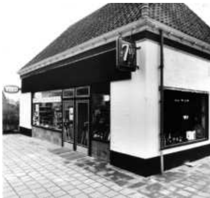
De verbouwde zaak in 1971

Ook zakelijk werd er behoorlijk aan de weg getimmerd, want in december 1964 nodigde hij alle Vordense kinderen tussen 0 tot 10 jaar uit om op 3 december hun schoen of klomp bij hem in de zaak te komen zetten en dan op 5 december om 3 uur te komen kijken wat Sint en Piet daarin hadden achtergelaten. Nu weet ik niet hoeveel kinderen aan die uitnodiging gehoor hebben gegeven, maar dat kunnen er zo maar een paar honderd geweest zijn, schat ik.