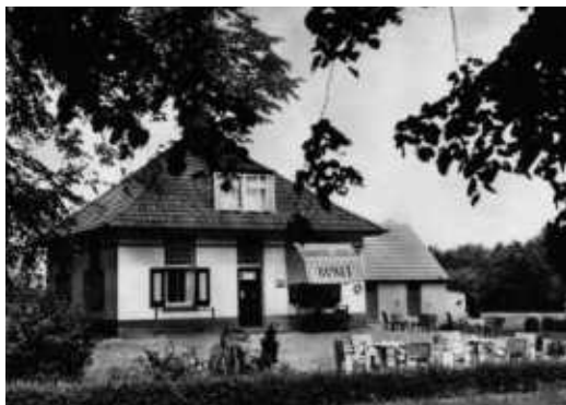
De bakkerij/kruidenierswinkel in de vroegere tuinmanswoning

Doordat in die tijd niemand meer elektriciteit had, moest al het machinale werk weer met de hand gedaan worden.