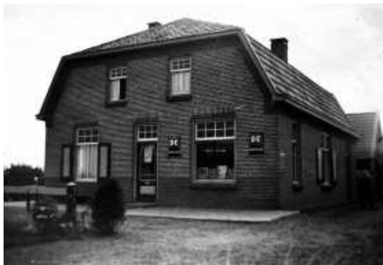
Het pand van Tolkamp

Wat de dagelijkse levensbehoeften betreft was men geheel zelfverzorgend, want op deel werden er varkens gehouden en de moestuin had een zeer behoorlijke oppervlakte.