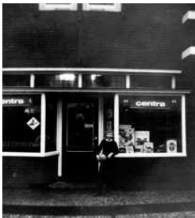
De winkel in de tijd van de familie Ten Brinke

Ook zij kregen te maken met het fenomeen supermarkten die bij hen zorgde voor langzame omzetsdaling en uiteindelijke sluiting van het bedrijf door mee te werken aan een saneringsregeling.