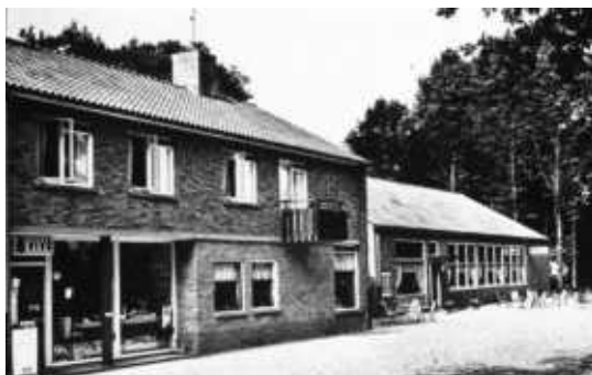
Het pand in de 70er jaren, v.l.n.r: winkel; woonhuis; café; zaal

In 1976 ging het bedrijf over op zoon Theo, die het pand en omliggend terrein in 1980 kocht van de kerk. Om gezondheidsredenen was Theo genoodzaakt wat gas terug te nemen en hij stopte in 1982 met de kruideniersactiviteiten.