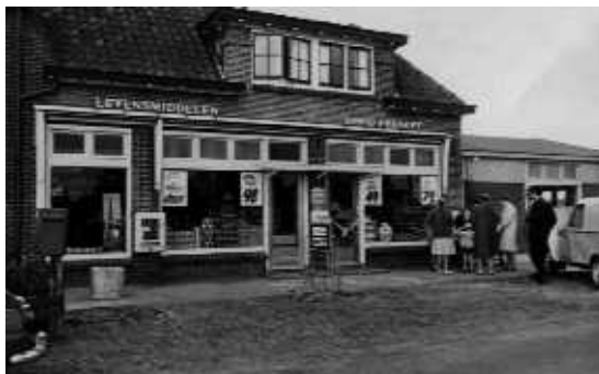
Het pand na de verbouwing in 1959

De zaken gingen goed, evenals het huwelijk, want er werden acht kinderen geboren.