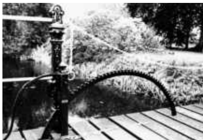
De klapconstructie van de brug