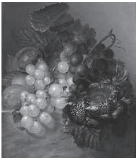
H.A.T. van Stipriaan Luisçius, stilleven met fruit en vogelnestje. Collectie Stedelijk Museum Breda.

Koud en guur is 't lenteweder; Buldrend jaagt de storm door 't woud; 't Jeugdig groen, zoo rein als teeder, Had op zoeler lucht vertrouwd. 't Donzig knopje is naauw ontloken, Smachtend naar een koestrend vuur, Of de windvlaag, losgebroken, Stremt de ontbinding der natuur.