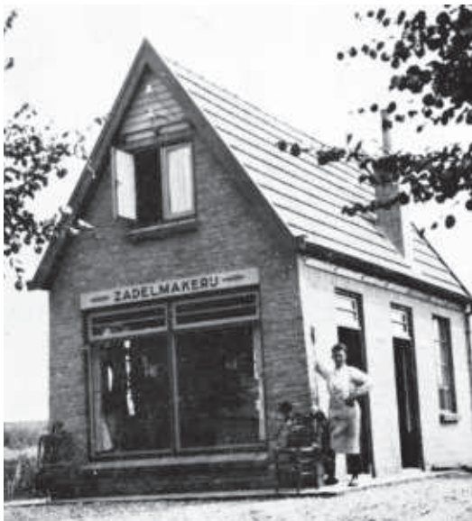
Pand zadelmaker Luimes in 1930

daar onder andere aardappels en groente. Ik heb daar mijn eerste zakgeld verdiend met het zoeken en over de kling jagen van vele honderden Coloradokevers. Ondertussen is dat bouwland echter verdwenen en zijn hier een vijftal panden verzezen.