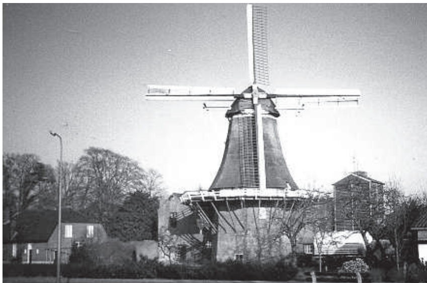
Molen De Hoop in 1989

In 1952 werd er een pakhuis aan de molen gebouwd voor de opslag van zakgoed. Enkele jaren later werden er in de molen zelf graansilo's getimmerd. Eén graansilo werd voorzien van een drooginrichting om graan te drogen.