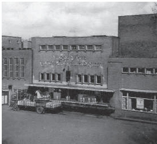
Coöp. Zuivelfabriek ca. 1955

Vlak na de oorlog heb ik daar voor het eerst in mijn leven echt wit brood gezien en meegenomen naar huis. Sorry, gestolen dus uit de afvalbak, of is dat geen stelen? Twee heel grote broden maar liefst, mijn moeder heeft ze in tweeën gesneden en ik heb onze burens ook een halfje gebracht, het smaakte naar cake! Ik vertelde al, bij de boterfabriek was altijd wat te beleven, vele, vele uren heb ik daar doorgebracht als er niets te voetballen was tenminste.