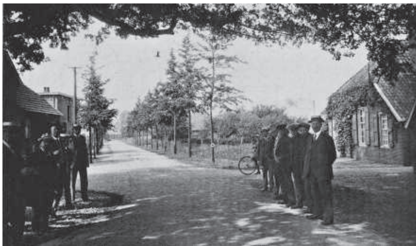
Opening Nieuwe Weg in 1924

De verharding van het toenmalige Kromme Pad vond plaats in 1924 en was onderdeel van de aanleg van een verharde weg van Vorden naar Almen. Dit was toen zeker een aangelegenheid op interlokaal niveau, want bij de opening waren notabelen aanwezig uit o.a. Almen, Gorssel en Eefde.