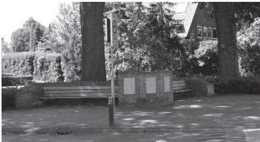
Galléemonument met banken