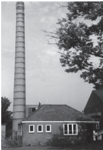
Groene Kruisgebouw en schoorsteenpijp in 1988

Naast ons huis stond de nieuwe boterfabriek, gebouwd in 1929. De officiële naam stond met vergulde letters op de gevel: “Vordensche Coöp. Zuivelfabriek”.