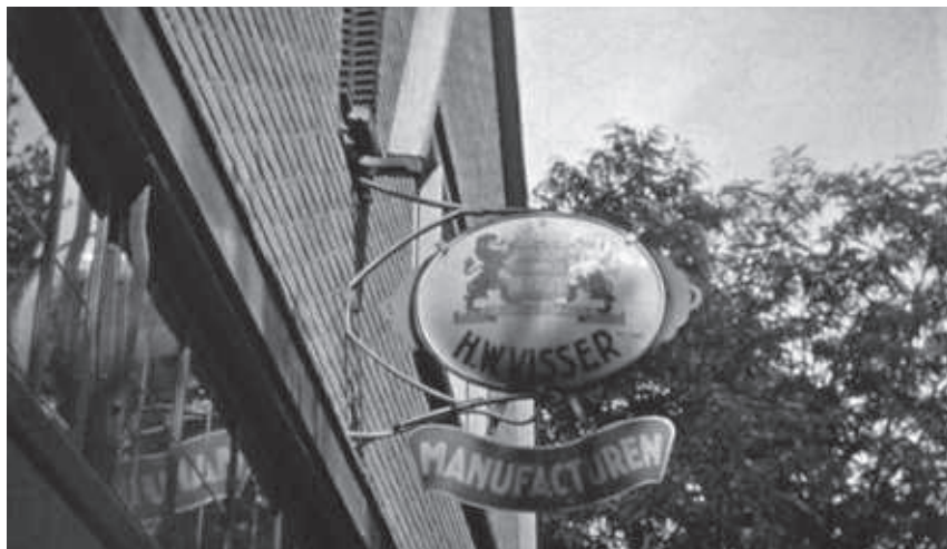
H.W. Visser - de oprichter

B.G.9: Zoals gezegd was het volgende pand van manufacturier Visser, tegenwoordig bekend als Visser Mode.