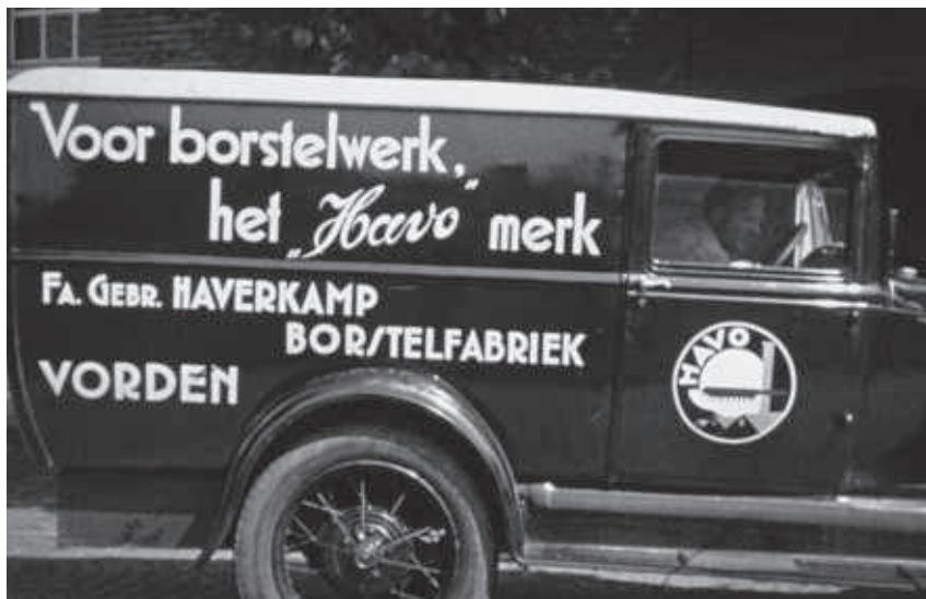
Eigen vervoer van Havo borstelfabriek

Enkele jaren geleden is het gebouw gesloopt om plaats te maken voor woningbouw. Door gebrek aan belangstelling en bevolkingskrimp is dit plan in de ijskast gezet.