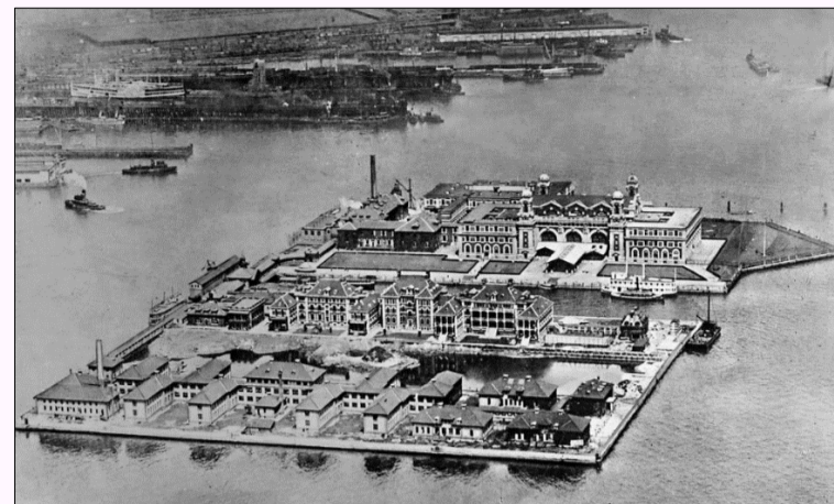
Ellis Island (Het Geheugen van Nederland)

De familie vestigde zich in Sioux Center , dat was gesticht door volgelingen van Ds. Scholte , een van de aanvoerders van de Afgescheidenen.