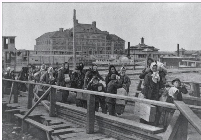
Aankomst op Ellis island, New York