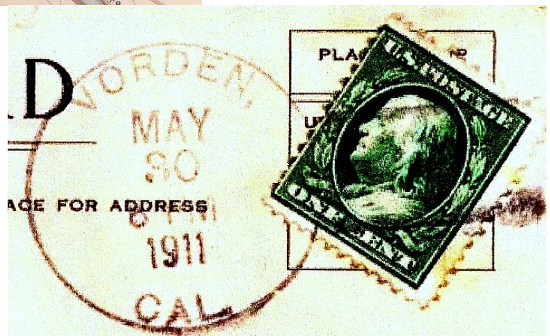
Poststempel Vorden CA 1911

Dit is een samenvatting van het artikel Vorden, CA, door A.C.J. Viersen, gepubliceerd in de Vordense Kronyck 2012, nr. 1.