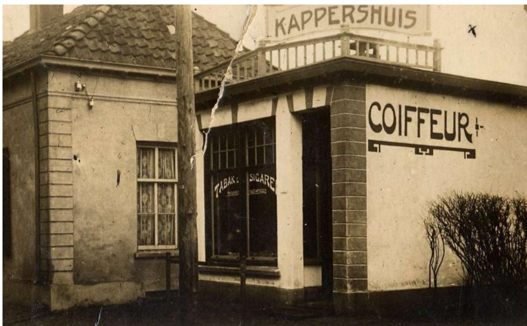
De aanbouw aan het pand aan de Kerkstraat (1923).