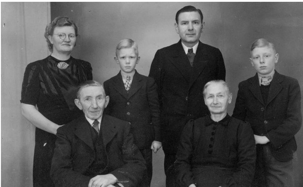
Dit is een verkorte weergave van het gelijknamige artikel, door Wim Jansen, gepubliceerd in de Vordense Kronyck van december 2016