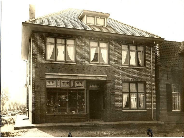
Het nieuwe pand aan de Dorpsstraat, gebouwd in 1929.